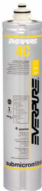
4C Filterpatrone EV960100

Liefert Premiumwasser höchster Qualität für Kaltgetränkessysteme